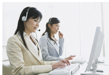
サテライトオフィス